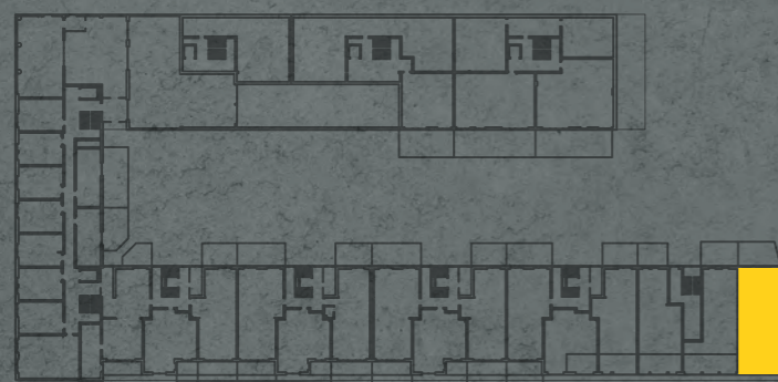
umístění bytu na 1. pp