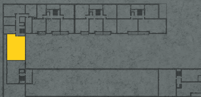
umístění bytu na 3. np